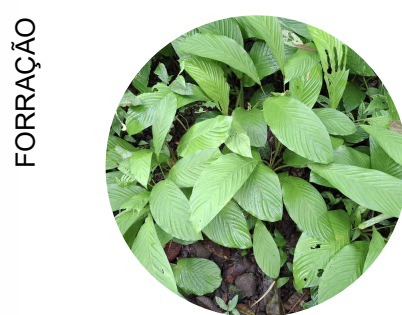
9 . calathea Calathea parsonsiana