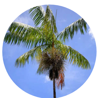
1 . açaí Euterpe oleracea