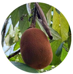
5 . cupuaçu Theobroma grandiflorum