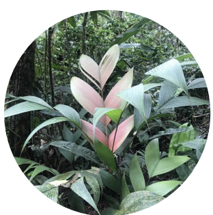
7 . ubiratama Geonoma divers