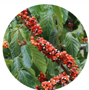
3 . guaraná Paulinia cupanensis