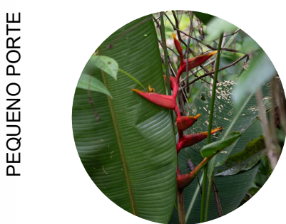
6 . helicônia Heliconia spathocircinata