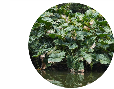
8 . filodendro ondulado Philodendron undulatum