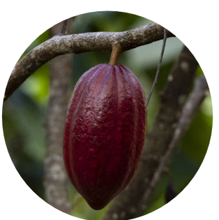
4 . cacau Theobroma cacao