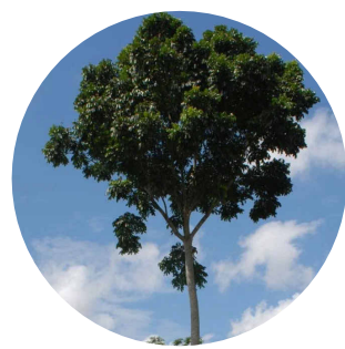
2 . andiroba Carapa guianensis