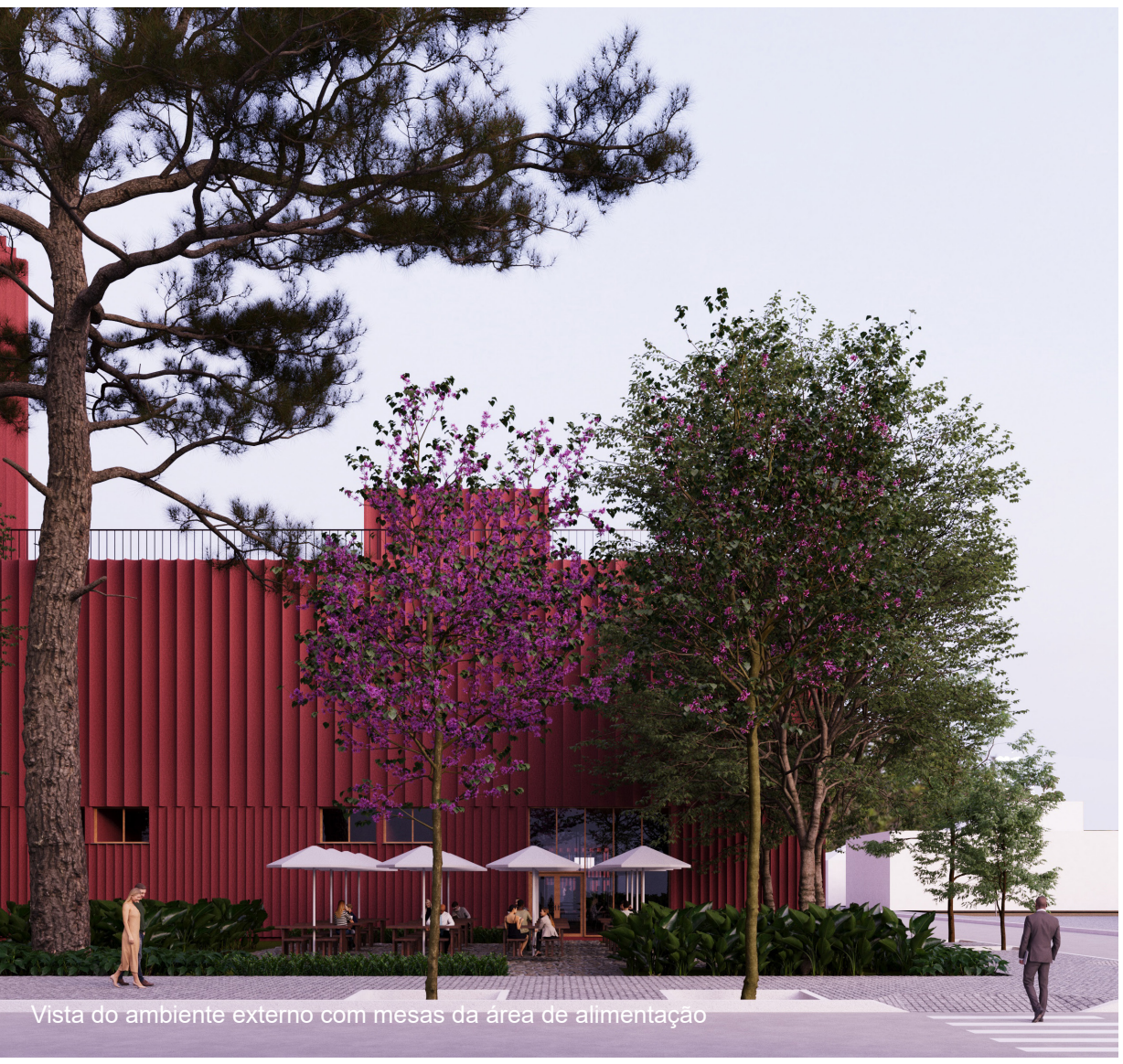
Vista do ambiente externo com mesas da área de alimentação