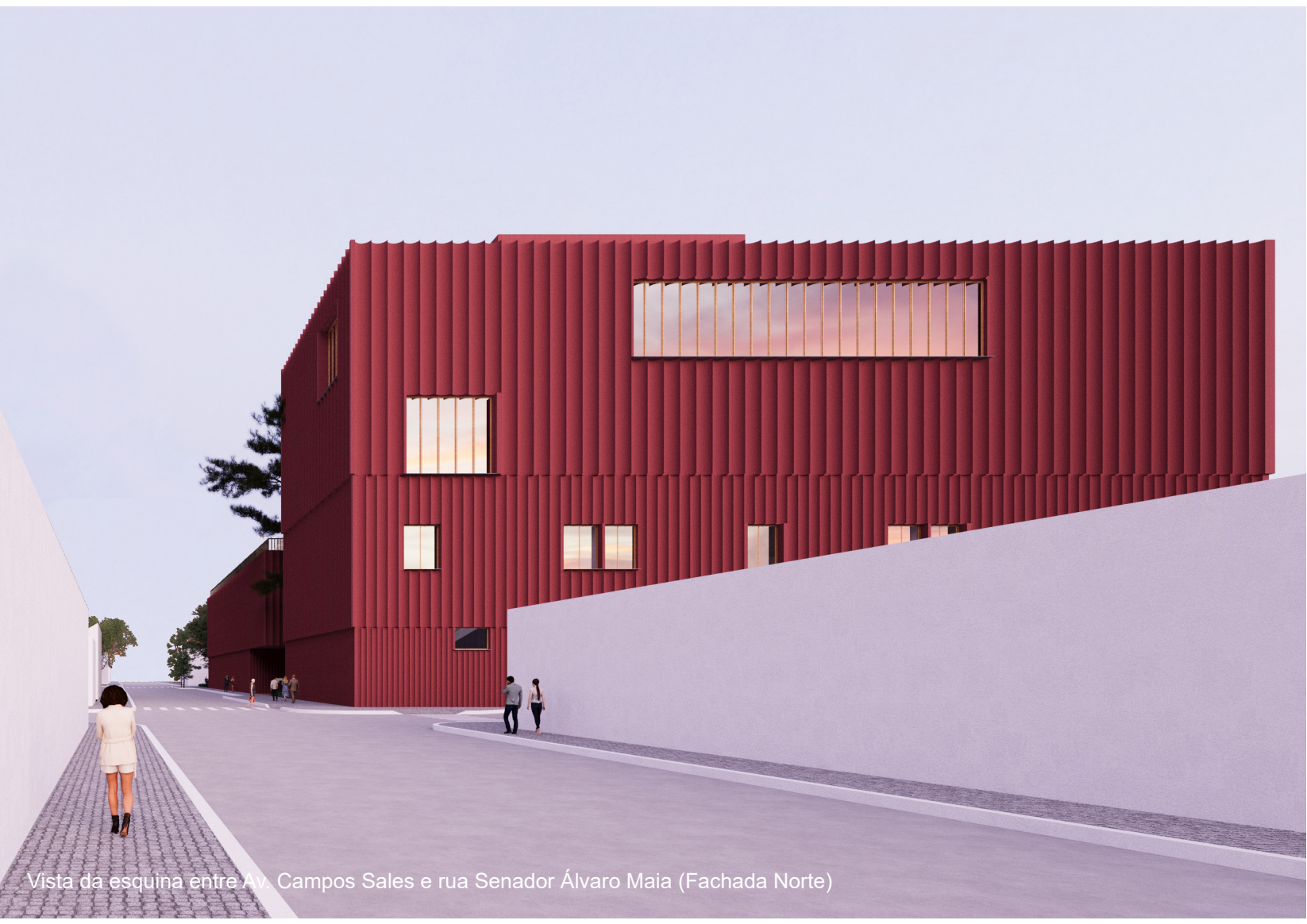
Vista da esquina entre Av. Campos Sales e rua Senador Alvaro Maia (Fachada Norte)