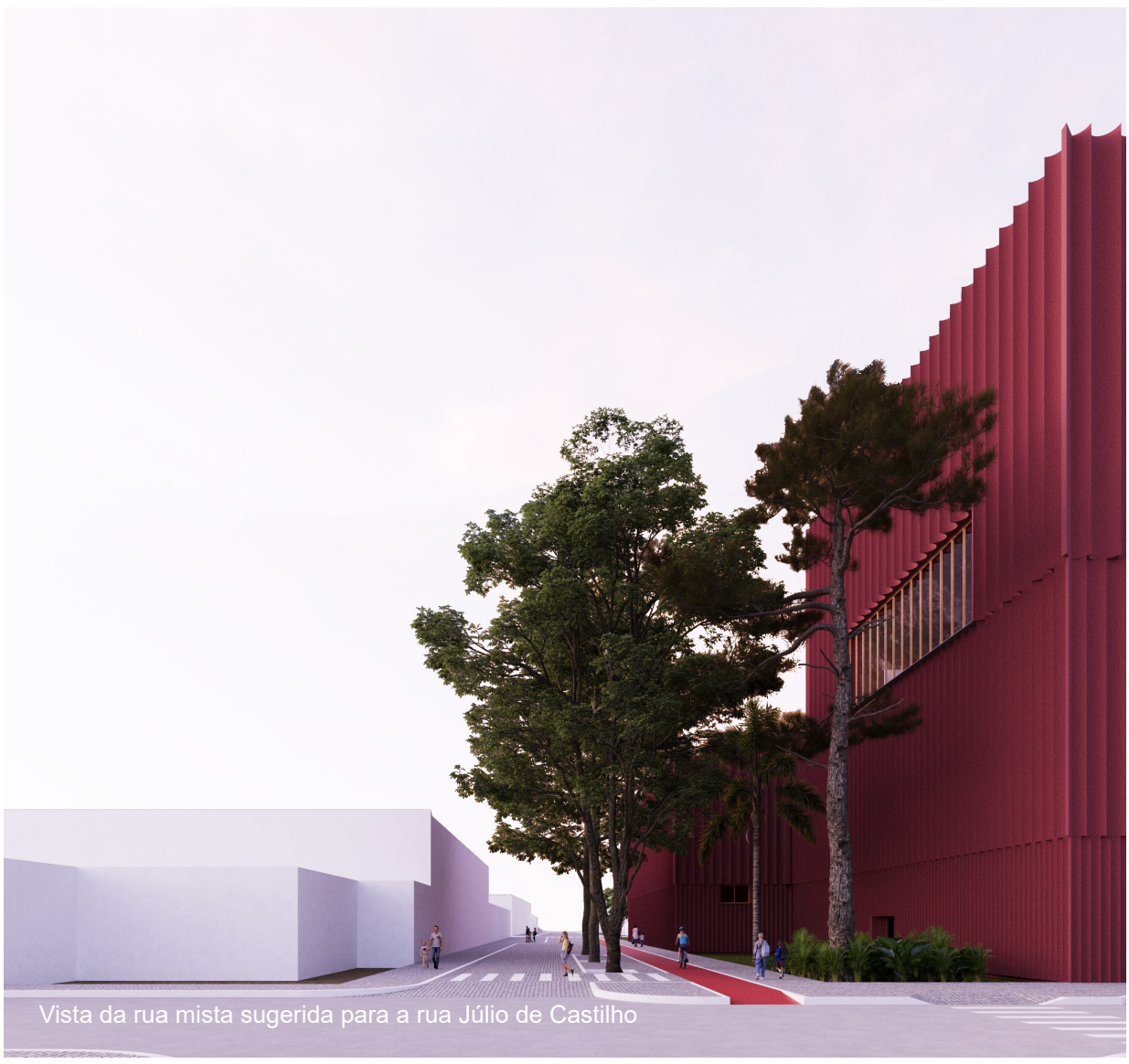
Vista da rua mista sugerida para a rua Júlio de Castilho