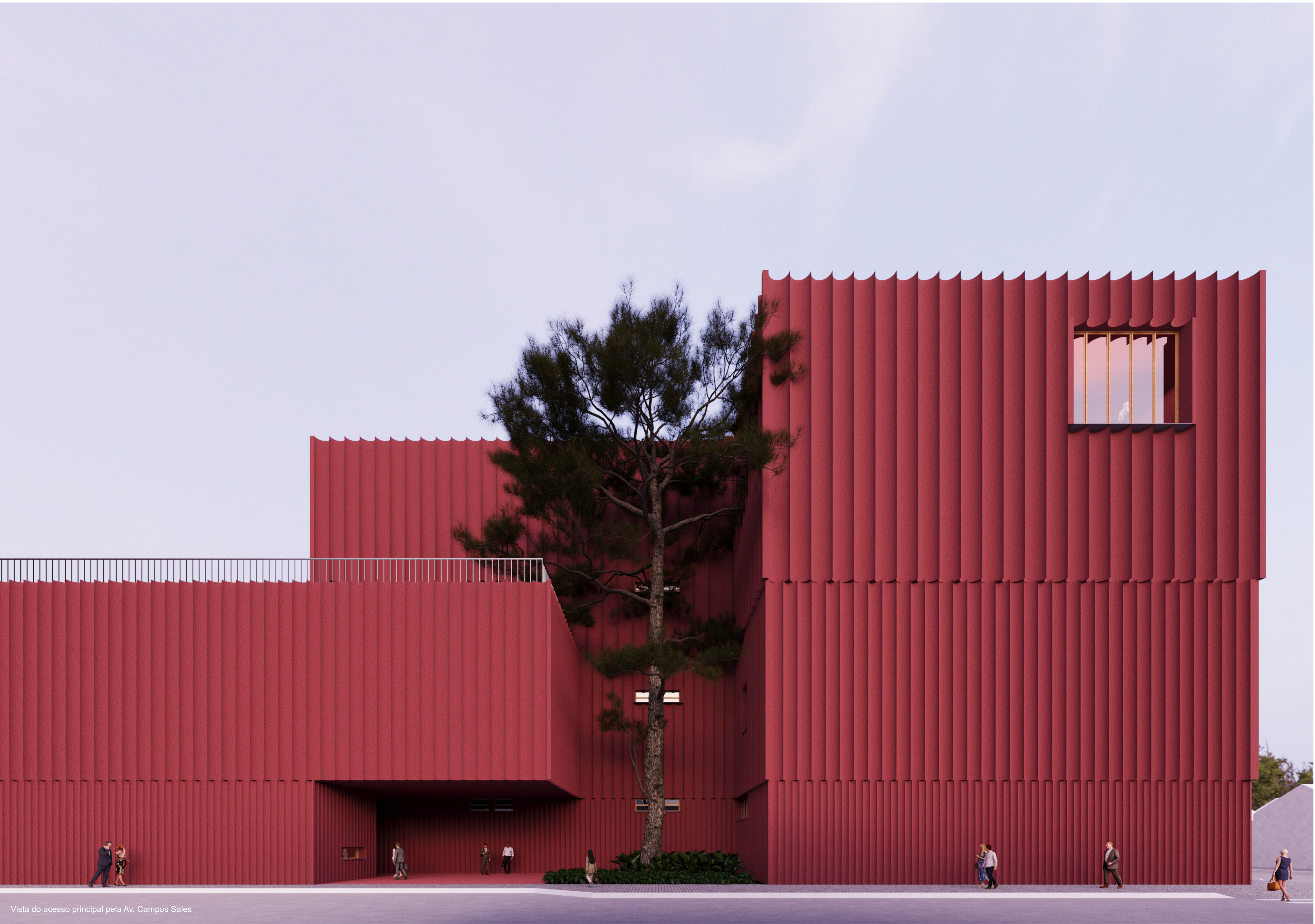
Vista do acesso principal pela Av. Campos Sales